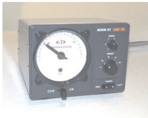
Steuergerät mit Preset und regelbarer Geschwindigkeit