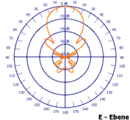
E - Ebene