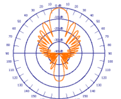
H - Ebene